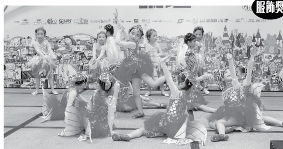
▲ 明慧國際幼稚園(北角分校)的演出，一群小朋友的魚兒造型突出，服飾仔細，終成為「最佳服飾獎」的得獎隊伍。