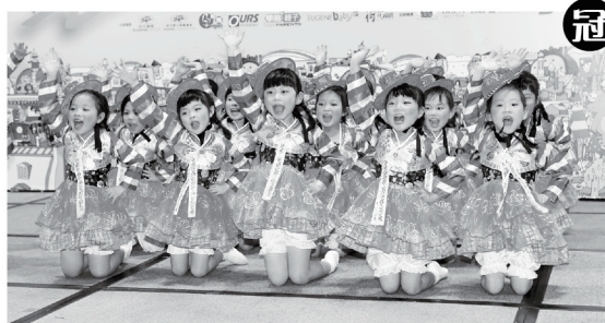
▲ 仁濟醫院明德幼稚園以精采的韓國舞蹈表演，博得全場熱烈掌聲，勇奪冠軍。