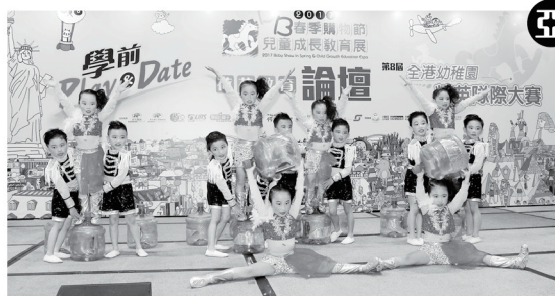
▲ 天樂幼稚園暨幼兒園的一班小朋友做出一系列高難度的動作，實力非凡，最終獲得亞軍。